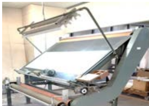
左：1号検反機、 右：2号検反機